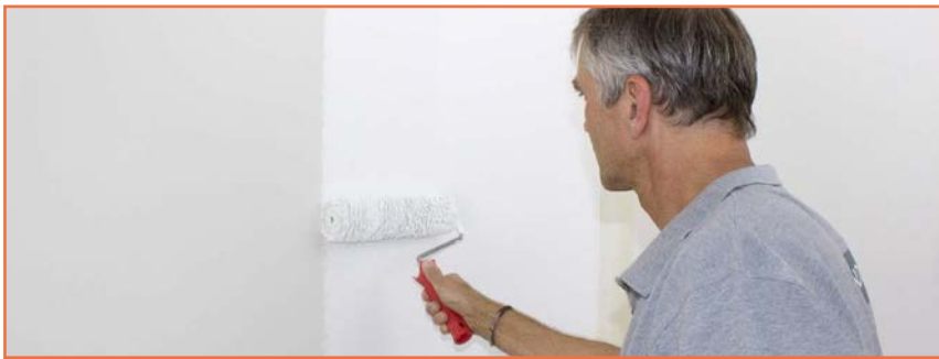
// Vorbereitung der Untergründe mit der Putzgrundierung.

Die Putzgrundierungen sind gebrauchsfertig auf der Basis Kali-Wasserglas, die bei Bedarf noch weiter mit Wasser verdünnt werden können (Richtwert: + ca. 10 %). Der Auftrag erfolgt meist mit der Rolle. Das Korn des Lehmstreich- und -rollputz kann an diesem körnigen Untergrund besser hängen bleiben, so dass die Kornverteilung homogen ist. Außerdem schaffen die Grundierungen einen einheitlich weißen Untergrund, damit die nachfolgenden Anstriche ihre volle Farbkraft entfalten können.